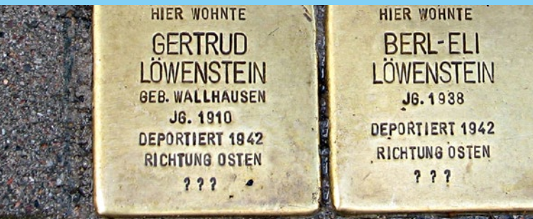
Stolpersteine der Familie Löwenstein